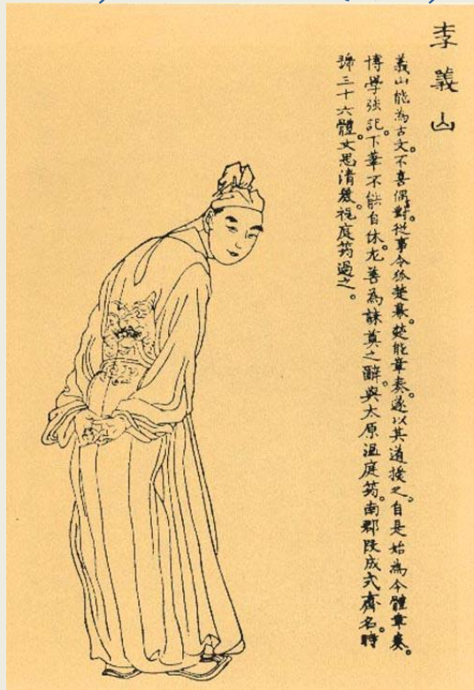
清《晚笑堂竹庄画传》李商隐像