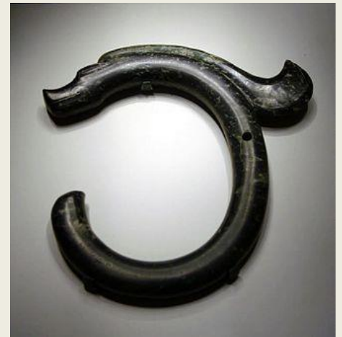
红山玉龙：寻龙玦 | 中华国宝

帝王与龙： 中国各民族皆有以“龙”的形象为图腾的文化：如内蒙古地区出土的红山玉龙，距今已有五千三百多年的历史，它由墨绿色的岫岩玉雕琢而成，周身光洁，雕琢精美，有“中华第一龙”的美誉。世界上的其它国家也出现过各种形象的“龙”。