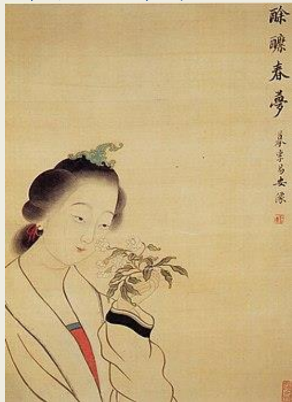
清人摹李清照画像